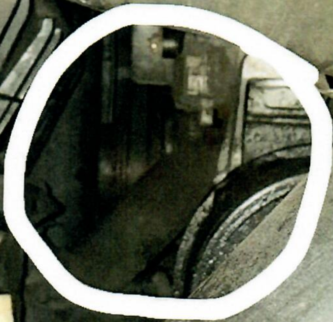
Kółko kompresora z paskiem klinowym